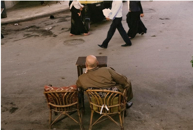
Ataba, Cairo, 2014