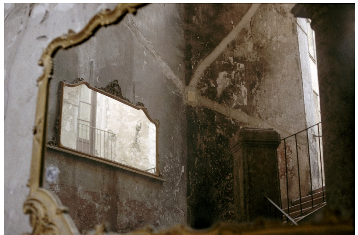
Dolci e salati, Palermo 2011